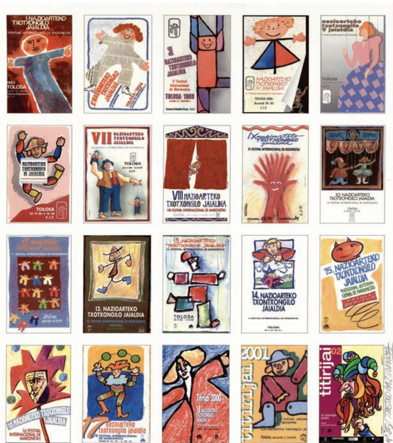
20 años contigo - 20 urte zurekin - 20 years with you

Con motivo de la celebración del 40 aniversario del Titirijai, proponemos una exposición de cartelera que recogerá los carteles de diferentes ediciones del festival de marionetas. Cada ejemplar tiene un diseño único creado para la ocasión, la abundancia de formas y colores son característicos de estos ejemplares que repasan la trayectoria que ha tenido esta festividad que traspasa fronteras.