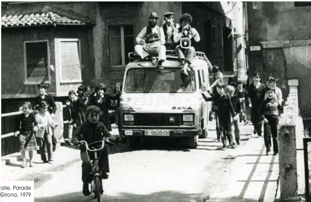
Kalejira, Pasacalle, Parade Camprodon, Girona, 1979

L'Estaquirot Teatreren ibilbidea eredugarria da, ez soilik haien lanaren eta jarreraren be-rezko dohainengatik, asko eta ezagunak baitira, baizik eta sinesgarritasun filosofikoz gor-