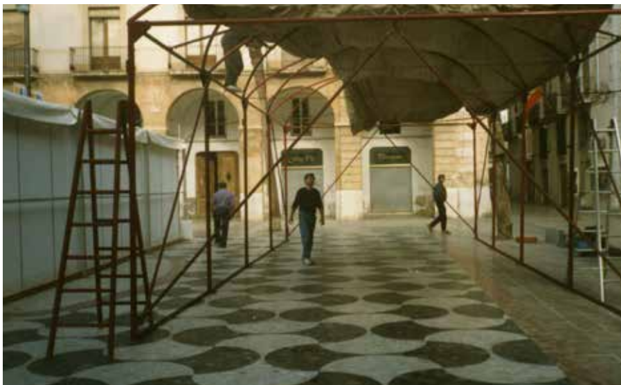
Txotxongiloen Teatro Ambulanteren muntaia Montaje del Teatro Ambulante de Titeres Assembly of the Teatro Ambulante of puppets Vilanova i la Geltrú, 1996