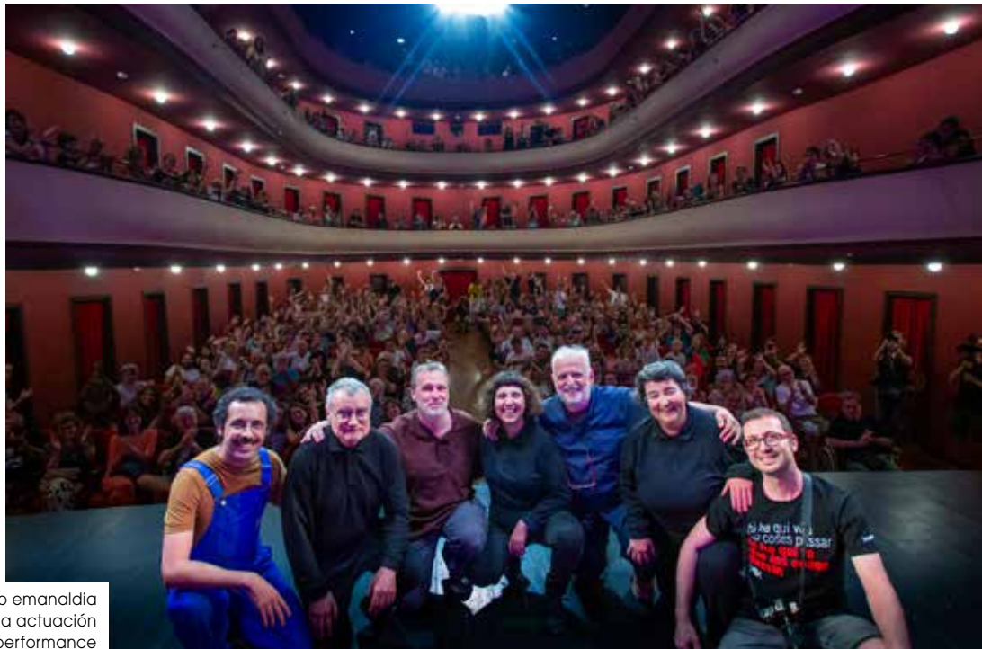
Taldeak, azkeneko emanaldia El equipo, última actuación The team, last performance Vilanova i la Geltrú, 2023

Zorte handia izan dugu 50 urtez lan egitea zerbaitetan sortzen ziguna hainbesteko plazera, piztu diguna jakin-mina, bultza gaituena txotxongiloei buruzko teknika eta prozedura mota guztiak ikertzera, eskaini diguna ikuskizun bakoitza su txikian pentsatzeko eta prestatzeko