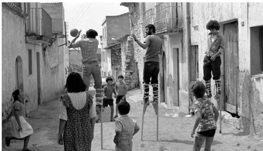
Kalejira, Pasacalle, Parade Ruta de verano, 1977 R. Casals