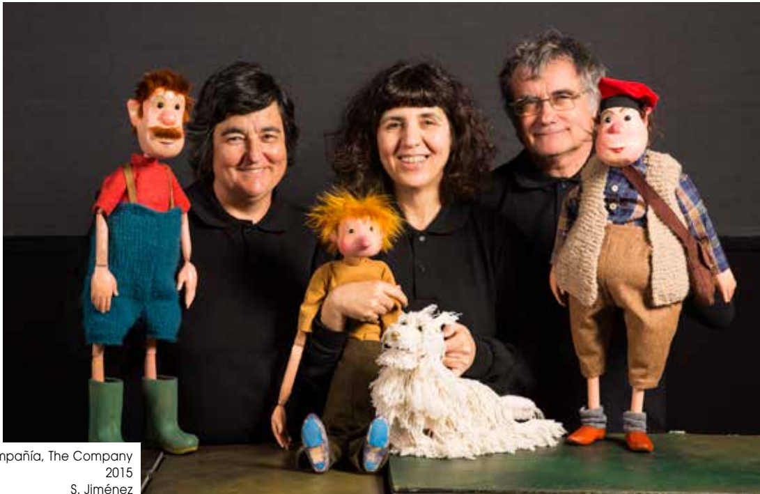
Konpainia, La compañía, The Company 2015 S. Jiménez

Eta, jakina, ezin dugu aipatu gabe utzi Oriol Ibañez, 2005etik gure argi-diseinatzaile leial eta zirt edo zarteko pertsona.