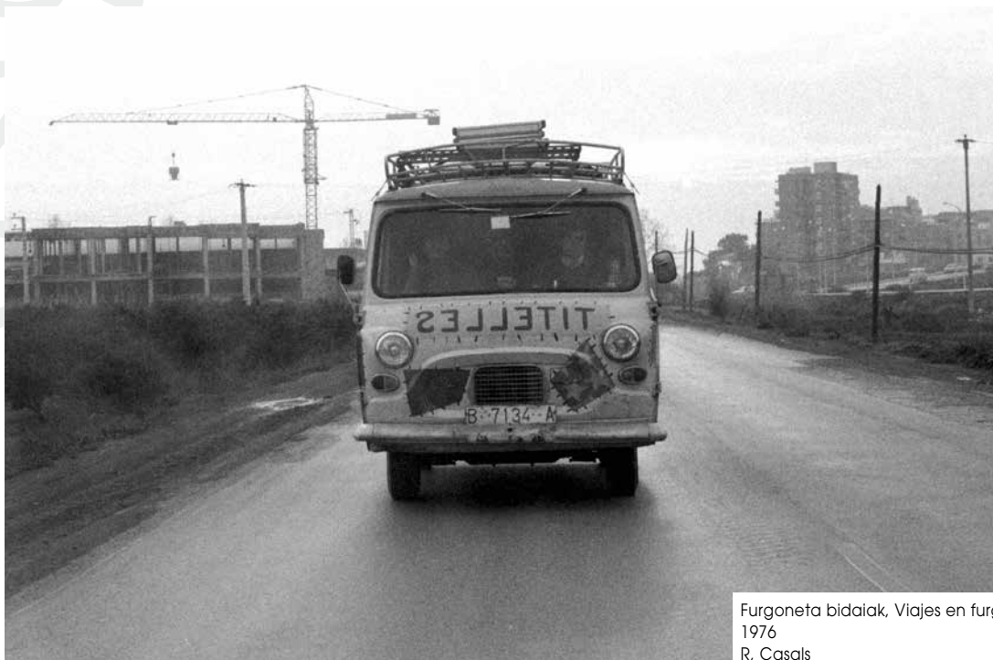
Furgoneta bidaiak, Viajes en furgoneta, Van trips 1976 R. Casals

Gure zauri fisikoak, gutxi-asko, azkartasunez orbaindu ziren; arimaren zauriak eta bizitzaren hutsuneak beste kontu bat dira. Ez dago zalantzan jartzetik urteek galera baten mina arintzen dutela, baina ezingo dute inoiz gure kidearen oroitzapena eta harekiko maitasuna ezabatu.