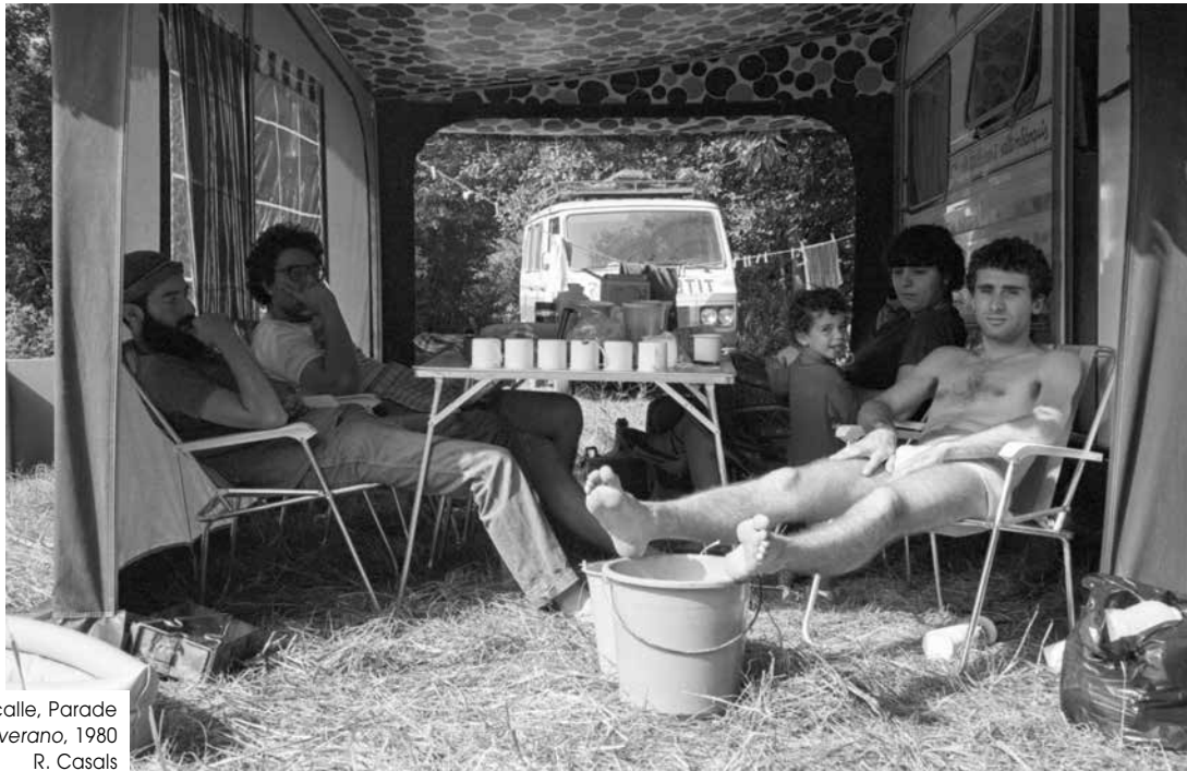
Kalejira, Pasacalle, Parade Ruta de verano, 1980 R. Casals

Beste gauza askoren artean, azkar ulertu zuten oholtza tradizionala aldatu egin zela, etxe magiko baten antzera ireki zituela leihoak, atea eta lorategi ezkutatuak. Bertako maiz- terrak, txotxongilolariak deiturikoak eta ordura arte ezkutatuak, bat-batean atera eta aktorez mozorrotu behar ziren. Berehala ikusi zuten hori, eta beti jokatu zuten kontuan hartuta..