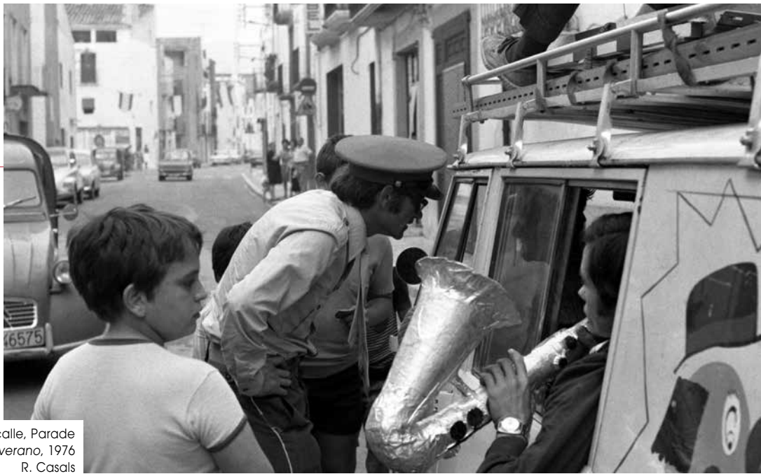
Kalejira, Pasacalle, Parade Rufa de verano, 1976 R. Casals

la para llevarla con nosotros a todas partes. Lo cierto es que hipnotizarla no era trabajo fácil y aunque en ocasiones lo conseguíamos, la mayoría de las veces la presencia del público le ponía nerviosa y no había manera de hipnotizarla. Finalmente decidimos que el hipnotizador de la gallina sería el que terminaría hipnotizado.