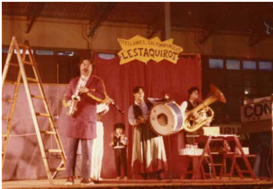
Tutilimundi Vilanova i la Geltrú, 1980

kin 4 egunetan bilduko genukeenaren ia erdia). Udal ingeniariak berak egiaztatu nahi ez duenez, desmuntatzea eta alde egitea erabaki dugu, eta ez da emanaldirik egongo.