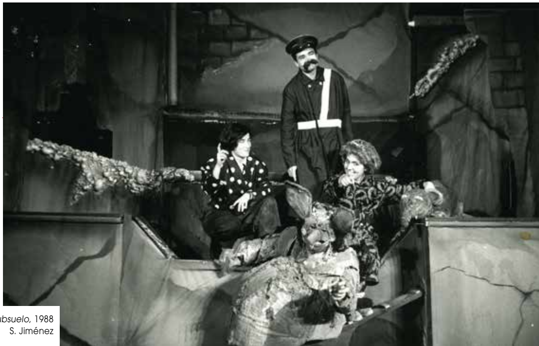
Subsuelo, 1988 S. Jiménez

para ser usada en la calle y que cumpliera unas condiciones que nos era imposible encontrar de otro modo. La conformaban unas tarimas elevadas que incluían todo lo necesario para la función. Se recreaban el submundo de las cloacas y de una depuradora.