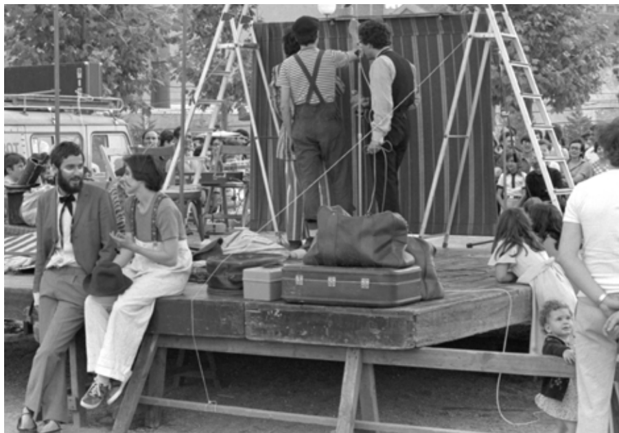
Barcelona , El Clot, 1977 R. Casals