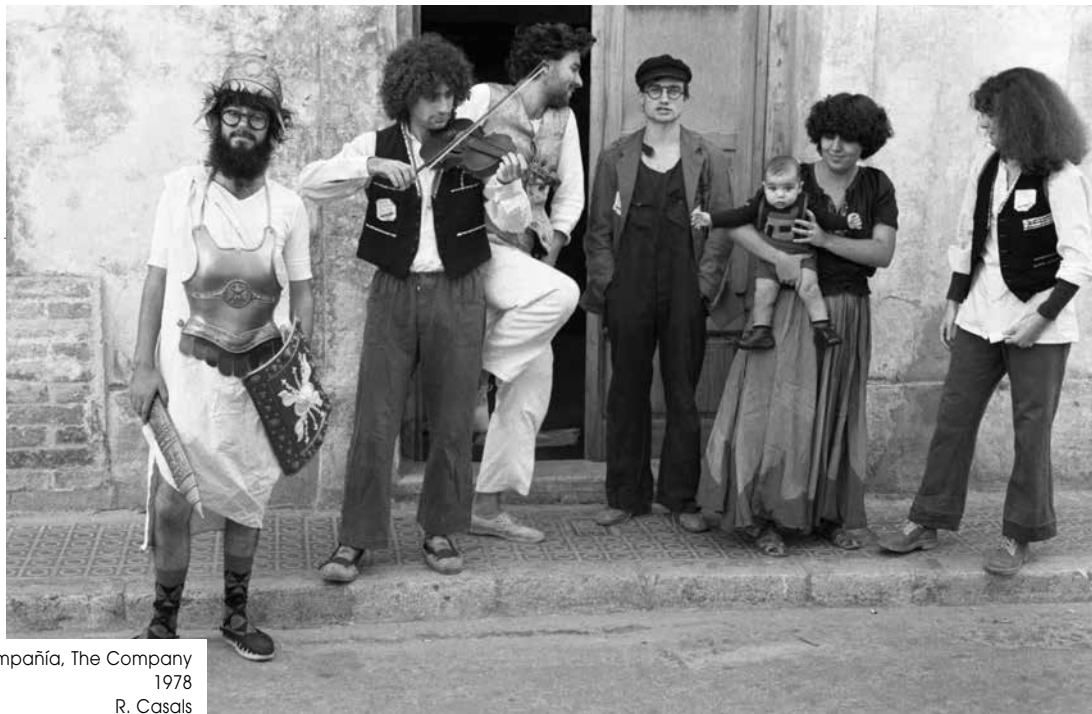
Konpainia. La compañía, The Company 1978 R. Casals

la gestión, la oficina y ponemos en marcha las creaciones. No obstante, cuando iniciamos un nuevo proyecto trabajamos siempre codo a codo con una serie de colaboradores.