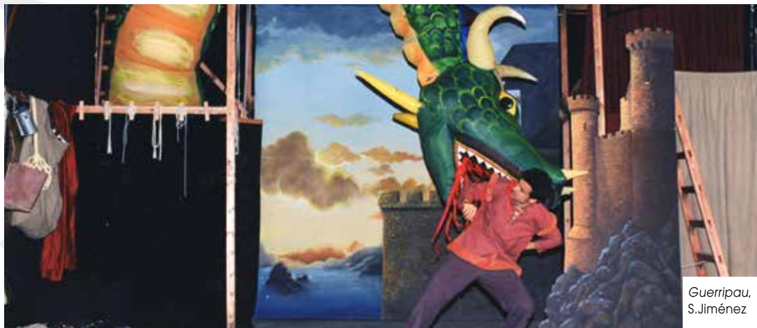
Guerripau, 1995 S.Jiménez

days and nights on it. In other words, we have been assembling and disassembling almost four years in a row of our lives, without batting an eye. And we've enjoyed it. We're thrilled we were able to do it!