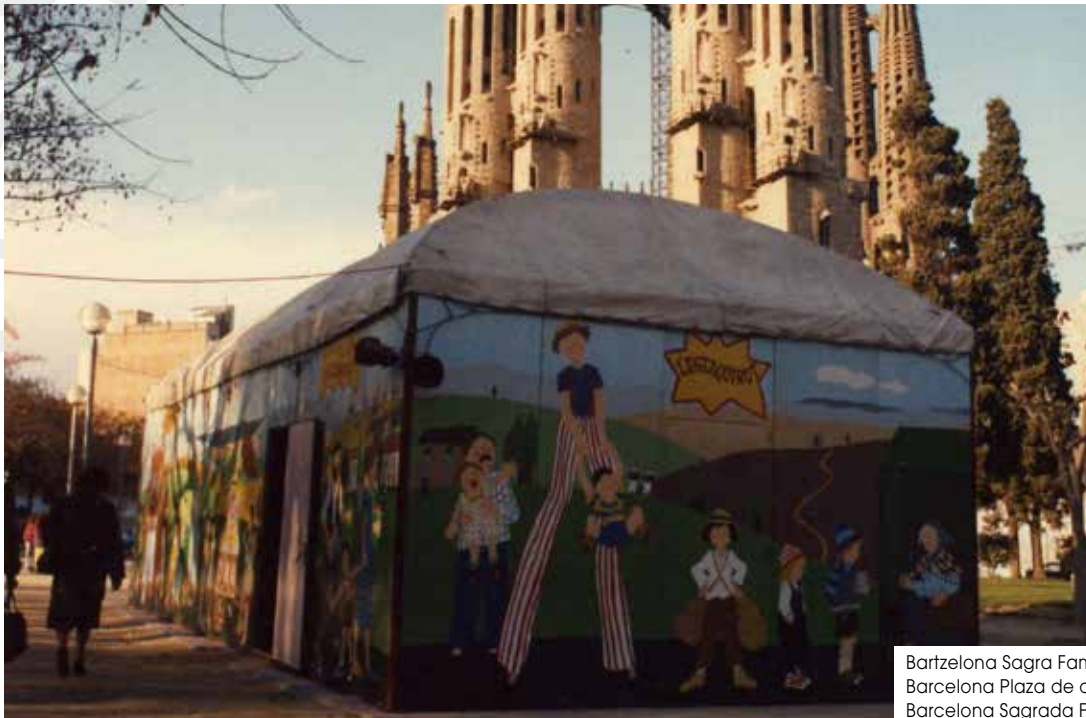
Bartzelona Sagra Familiaren plaza Barcelona Plaza de de Sagrada Familia Barcelona Sagrada Familias plaza 1983

Antzoki ibiltariaren edukiera 125 lagunekoa zen, aulki eta bankuetan eserita. Barruan, ikuslea kanpoko mundutik isolatzeko giro aproposa lortzen genuen; izan ere, argi eta soinuaren