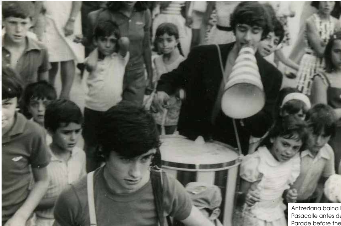
Antzezlana baina lehenagoko kalejira Pasacalle antes de la actuación Parade before the performance 1974

raz, megafonoa eskuan, Penedès eskualdeko herritxo batean, uda betean gaeko 10etan zen emanaldi baten berri eman genuen. Ordua iristean, herri guztia zegoen plazan, helduak eta haurrak, adinekoak eta gazteak, haien etxeetatik ekarri zituzten aulkietan jarrita. Sinestezina dirudi, baina emanaldiak arrakasta handia izan zuen. Haiei guri bezainbeste gustatu zitzairen. Txapela pasa genuenean berrehun pezeta bildu genituen, eta gastuak kitatzeko iristen ez zitzaigun arren -bost axola izan zitzaigun-, erakutsi ziguten txotxongilolarien bizitzak harrrapatu gintuela, baita hartzaren besarkadez harrapatu ere.