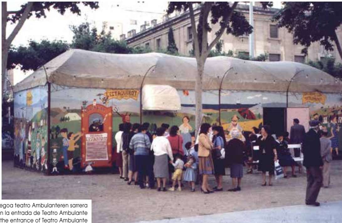
Ikuslegoa teatro Ambulanteren sarrera Publico en la entrada de Teatro Ambulante Public at the entrance of Teatro Ambulante Reus, 1984

kami” de la historia de Cataluña. 179 personas y entidades hicieron una aportación de 1000 pesetas a cambio de un título de socio y entradas para las funciones que se harían durante la Feria de Noviembre en Vilanova.