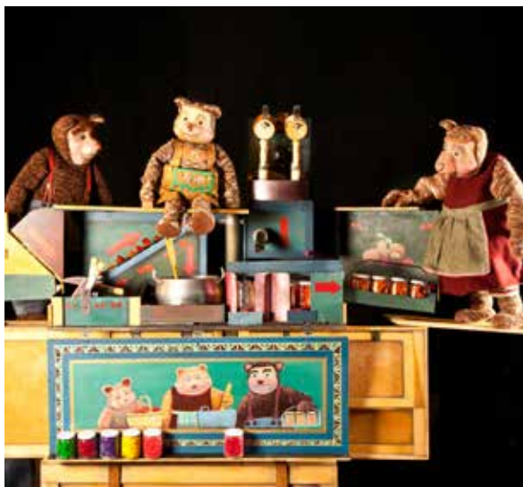
Los tres Osos , 2012 S. Jiménez

Gure janzkera, beti beltzez, gutxi argizatuta eta txapela batez. Maneatzaile ginenez, gure begiradak ez zuen ez ardazten ezta oztopatzen. Istorioan parte hartzen genuen gure manei u zeregina utzi gabe, narratzaile/aktore gisa edo zuzenean txotxongilo ei zegokienez, eta horri esker, istorioek beti zituzten sakonera-plano diferenteak eta narrazio-maila ezberdinak, ikusleen espektro zabalago eta anitzago batera iristeko.