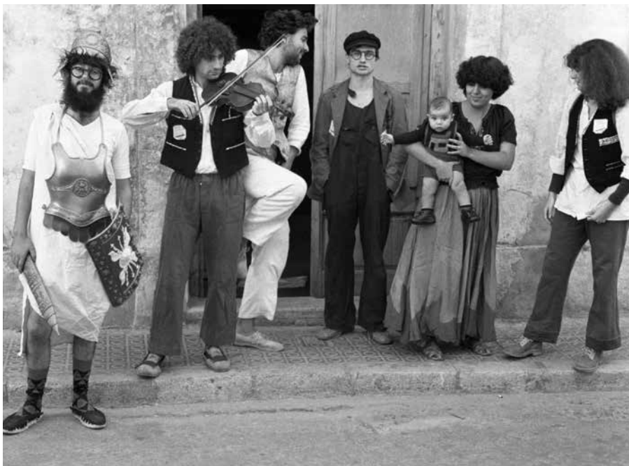
Konpainia, La compañía, The company 1978 R. Casals