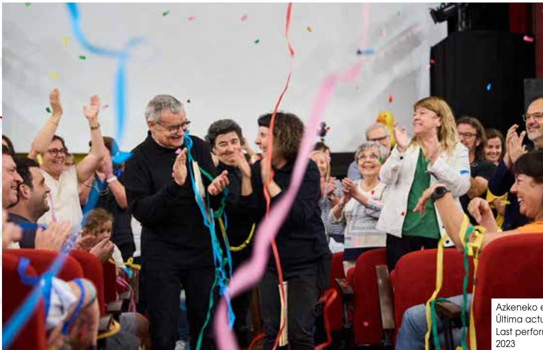
Azkeneko emanaldia Última actuación Last performance 2023

cerrando las puertas en el momento en el que las cosas aún funcionaban muy bien.