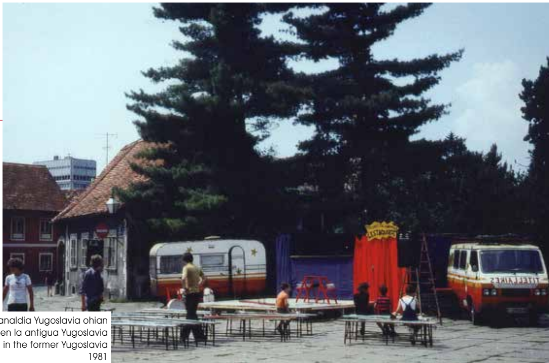
Emanaldia Yugoslavia ohian Actuación en la antigua Yugoslavia Performance in the former Yugoslavia 1981

ducidos a diferentes hospitales. La respuesta de los colectivos de la profesión fue inmediata: se reunieron y asumieron todas las actuaciones que l'Estaquirot tenía contratadas y otras nuevas a fondo perdido, ingresando los importes en una cuenta para que pudiéramos comprar una nueva furgoneta y rehacer todo el material.